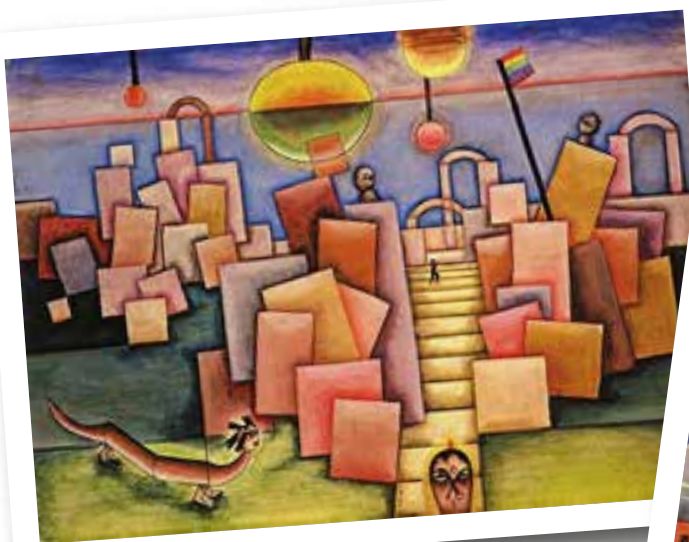
Rocas Lagui, 1933

* Mirá la obra de Xul solar acá: https://youtu.be/XMuf-EhJ5n0