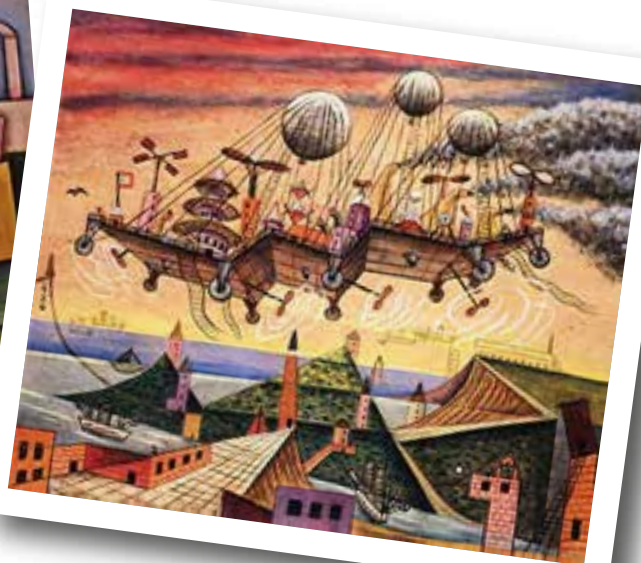
Vuel villa, 1936