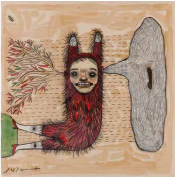
Sin título - 2019 - Técnica mixta - 30 x 30 cm.