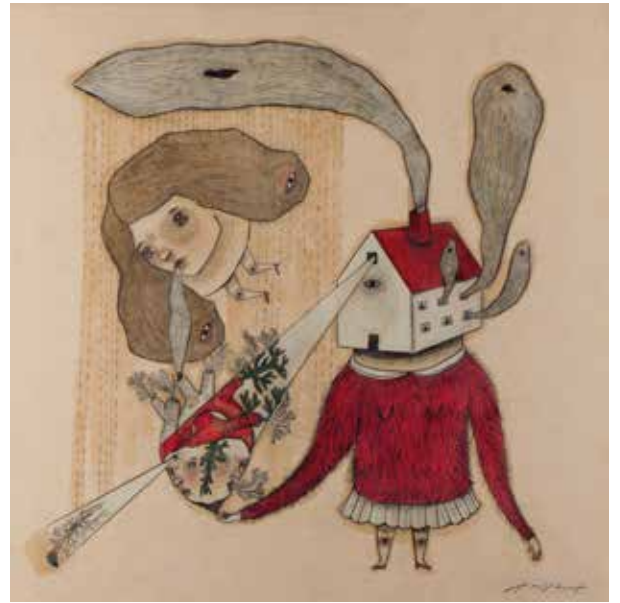
Sin título - 2018 - Técnica mixta - 60 x 60 cm.