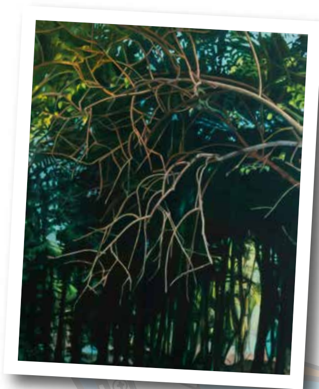
Ramas en escena - 2021 Acrílico s/tela - 200 x 160 cm.

¿Tal vez será la necesidad de mirar con claridad hacia dentro suyo?