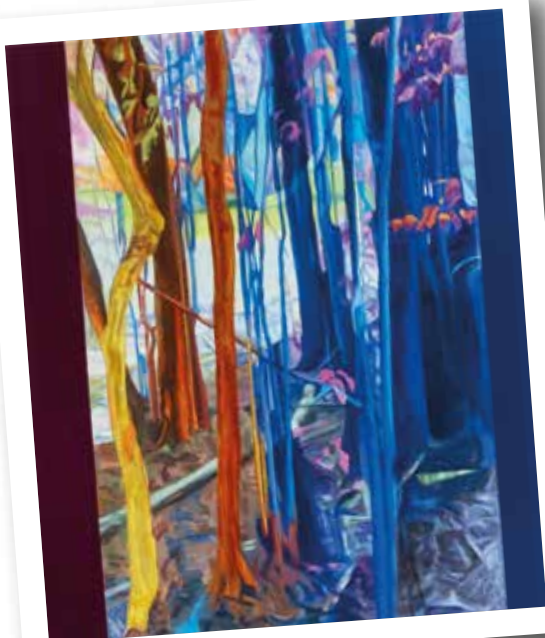
Así sucede - 2021 Acrílico s/tela - 100 x 80 cm.

“...Todo es motivo para destacar que al final, no somos otra cosa que lo que somos. Que no hay realidad posiblesin nuestro espíritu siendo. Y que basta cerrar los ojos para ver el paisaje...” (extracto del texto de Marcos Acosta)